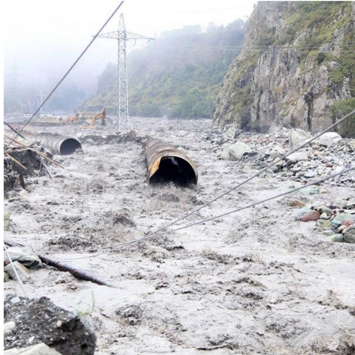
სურ.1. 2019 წლის 25 ივლისს მდ. მესტიაჭალის აუზში მომხდარი ნაზღველვეი წყალმოვარდნა