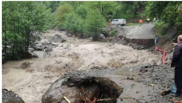
სურ. 4. მდ. ნენსკრას შედეგები, 2018 წლის 5 ივლისი.

მნიშვნელოვანია ასევე გარემოსა ეროვნული სააგენტოს მიერ დათვალიერებული ბუნებრივი ტბა „შავდელეს“ მონაკვეთზე, მესტიის გზის მიმდებარე ტერიტორიები ზემო სვანეთში, სადაც ნათლად ჩანს მეწყრული უბანი, რომელიც საშიშია. მას 40-45მ-იანი ქანობი აქვს. დათვალიერების დროს ამ მონაკვეთიდან გამოედინებოდა 0.5 ლიტრი დებეტის მქონე წყალი, რაც 1 საათში შეადგენს 1800 ლ წყალს. რადგანაც ჩაგუბებიდან საავტომობილო გზის მიმართულებით ხდება ამავე მოცულობის წყლის გადინება, ჩაგუბებაში წყლის დონის ცვლილება არ შეინიშნება. თუმცა ადგილობრივი მოსახლეობის გამოკითხვის საფუძველზე გამოიკვეთა ის ინფორმაცია, რომ როდესაც ხდება ატმოსფერული ნალექების სიჭარბე, მუდამ ხდება ამ ტერიტორიაზე წყალმოვარდნა და მუდამ ხდება საავტომობილო გზის დატბორვა, რისი გაწმენდაც უმეტესად ადგილობრივებს უხდებათ, რაც ასევე საშიშია.