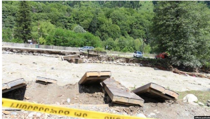
სურ. 3. მდ. ნენსკრას შედეგები, 2018 წლის 5 ივლისი.